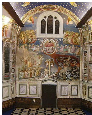
Cappella degli Scrovegni

lità e dell'anzianità. Dopo la celebrazione con gli ospiti e la sua toccante testimonianza, abbiamo compreso quanto ogni persona sia protagonista del proprio progetto di vita, che la realtà dell'Opera desidera costruire con lui. Nel pomeriggio un frate cappuccino ci ha guidati alla scoperta di San Leopoldo Mandic e del suo impegno nel dialogo tra Chiesa