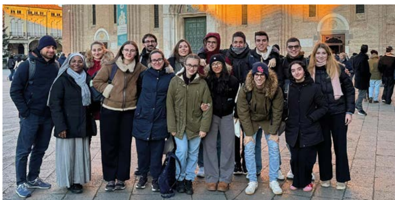
Basilica di Sant'Antonio