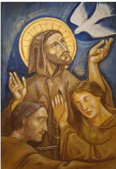
In copertina: opera di Carmelo Ciaramitaro

È vero: dov'è povertà con letizia, ivi non è cupidigia né avarizia. Sapremo divenire uomini e donne della Pasqua?